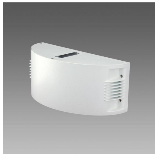
1279 Onda LED