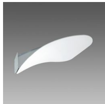
389 Lastra pegaso a parete