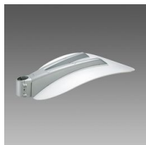
387 Lastra pegaso singola