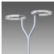
532 Braccio doppio