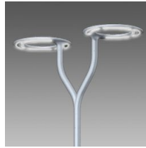
532 Braccio doppio