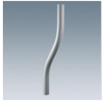
513 Braccio curvo per Aura