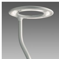
1441 Palo da interrare