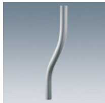
513 Braccio curvo per Aura