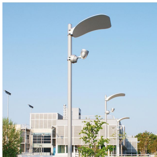
1487 palo da interrare - Pegaso