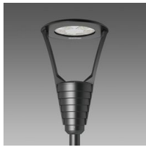
3355 Garda 5 - rotosimmetrico