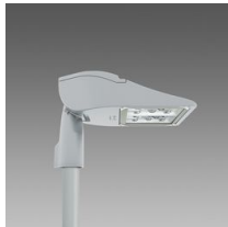
3280 Rolle - T1