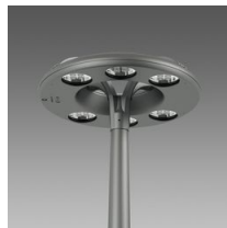
3334 Disco 5 - attacco centrale