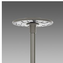
3590 Ischia - rosimmetrico fascio largo RW