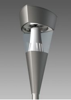
1513 Torcia LED COB