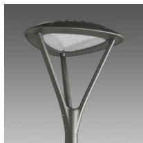
3340 Loto 2 - diffusore satinato