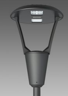
3362 Iseo 3 - centro strada