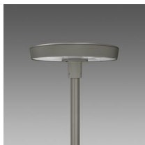
3336 Visconti 2.0 - rotosimmetrico