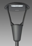
3361 Iseo 2 - stradale