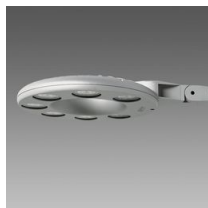
3331 Disco 2 - diffusore