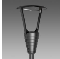
3353 Garda 4 - ciclabile + stradale