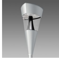
1707 Torcia LED