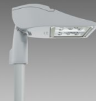
3281 Rolle - T2