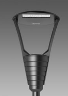
3351 Garda 2 - asimmetrico