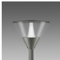
1570 Klima - LED