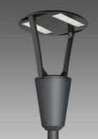
3383 Como 1 - rotosimmetrico