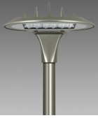
3580 Volo - stradale - High Performance