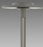
3595 Ischia - asimmetrico fascio medio AM