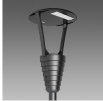
3352 Garda 3 - ciclabile