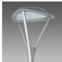
3344 Loto 5 - diffondente