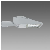
3284 Rolle - T5