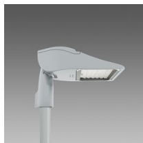
3286 Rolle - high performance