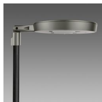
3339 Visconti 2.0 - grandi aree