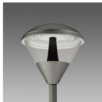
1518 Klima LED anti-inquinamento luminoso