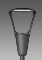
3384 Como 2 - asimmetrico