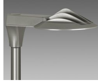
3583 Volo - rotosimmetrico