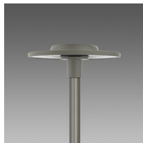
3591 Ischia - COB rosimmetrico fascio medio RM