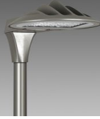
3582 Volo - ciclabile