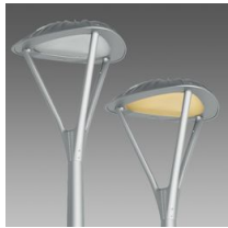
3345 Loto 6 - COB