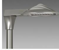
3581 Volo - ciclabile + stradale