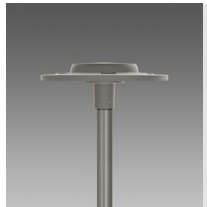
3596 Ischia MIDNIGHT - asimmetrico fascio largo AW