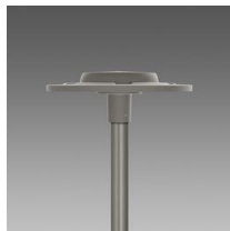
3592 Ischia - quadrato fascio largo SW