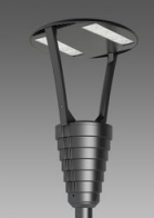
3350 Garda 1 - rotosimmetrico