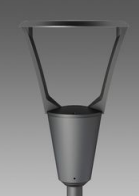
3386 Como 4 - bi-asimmetrico