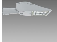
3282 Rolle - T3