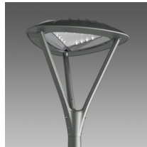
3342 Loto 3 - asimmetrico