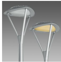
3345 Loto 6 - MIDNIGHT COB