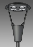
3360 Iseo 1 - rotosimmetrico