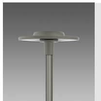
3591 Ischia MIDNIGHT - COB rosimmetrico fascio medio RM