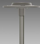
3596 Ischia - asimmetrico fascio largo AW