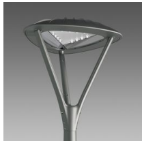
3340 Loto 1 - diffondente trasparente