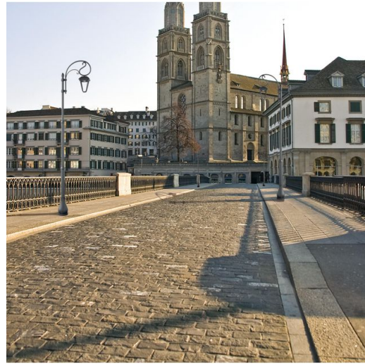
1498 Palo Liberty