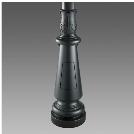
1410 Palo rastremato singolo con base