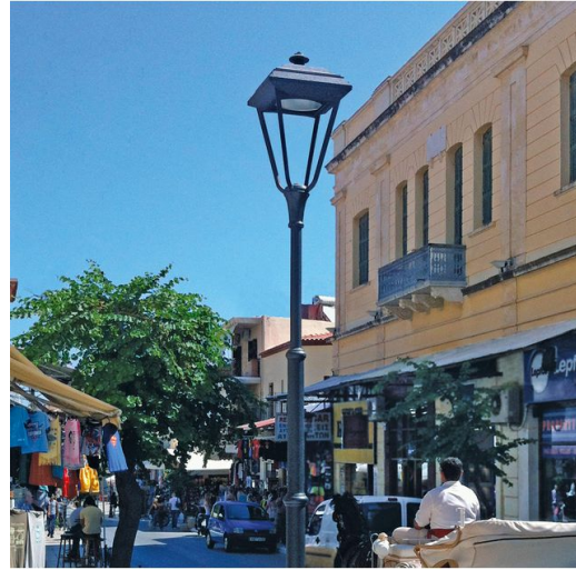
1411 Palo rastremato singolo da interrare