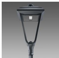
3322 Lucerna Q7 FX