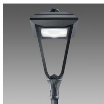
3202 Lucerna Q2 LED