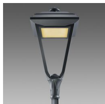
3202 Lucerna Q2 LED COB