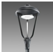
3212 Lucerna R LED