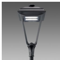
3209 Lucerna Q8 LED asimmetrico