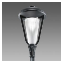
3214 Lucerna LED