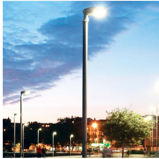
1418 Palo in acciaio ø102-159 da interrare