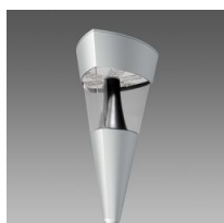
1707 Torcia LED