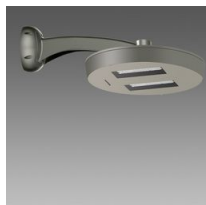
3328 Visconti 2.0 - stradale ME