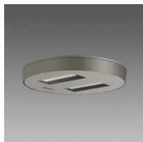
3327 Visconti 2.0 - stradale ME