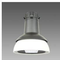
3142 Campana LED