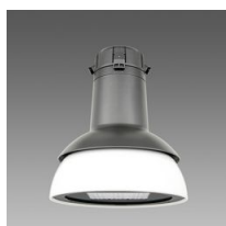
3146 Campana LED