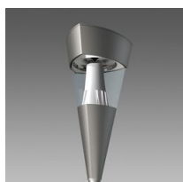
1513 Torcia LED COB