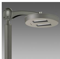
3329 Visconti 2.0 - stradale ME