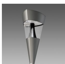
1708 Torcia LED