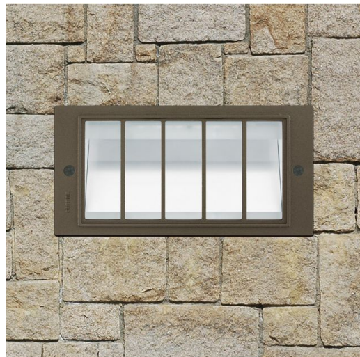
1210 Box LED