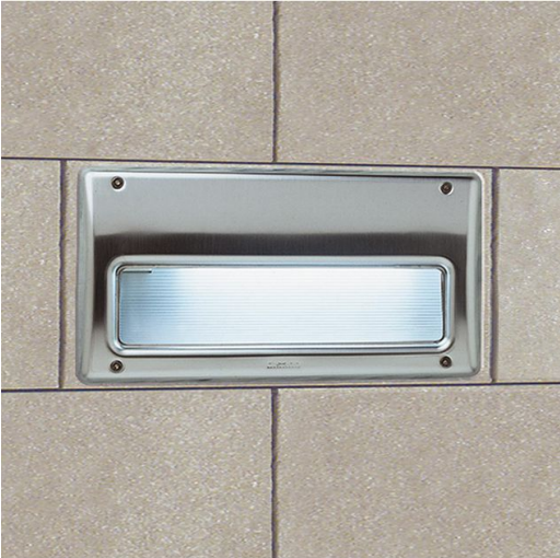
1609 Box 1 - LED