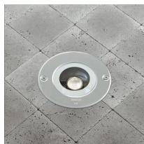
1871 Midifloor LED fullcolor - orientabile