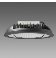
2793 Astro HT - UGR<25 - high temperature