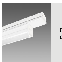
6616 Techno System HE - diffusore semisferico diffondente - CRI 80