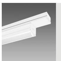
6605 Techno System - diffusore semisferico diffondente - CRI 90