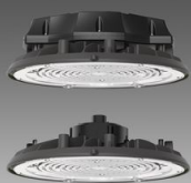
2885 Saturno \varnothing 370 HP - high performance