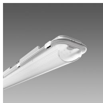
971 Ottima - High Performance