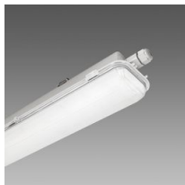
963 Hydro LED - High Performance