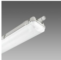
957 Echo - bilampada LED - High Performance