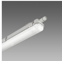
957 Echo - monolampada LED - High Performance