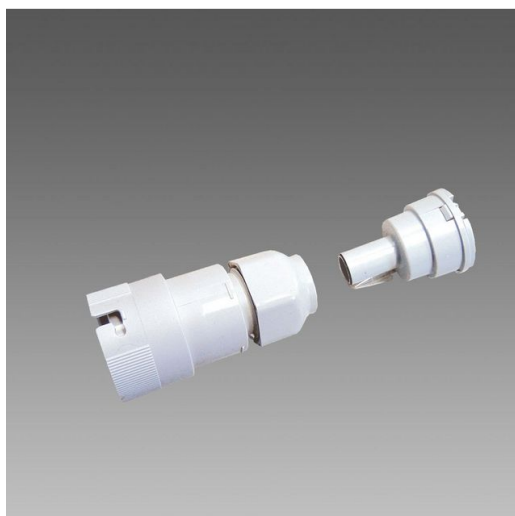
370 Innesto per tubo diam.20