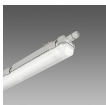
957 Echo - monolampada LED - High Performance