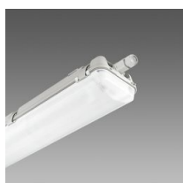
957 Echo - bilampada LED - High Performance