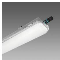
972 Hydro Style - alta resistenza agli agenti chimici