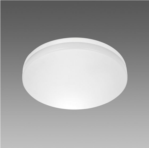
Pastilla J 2.0 - EM 1h