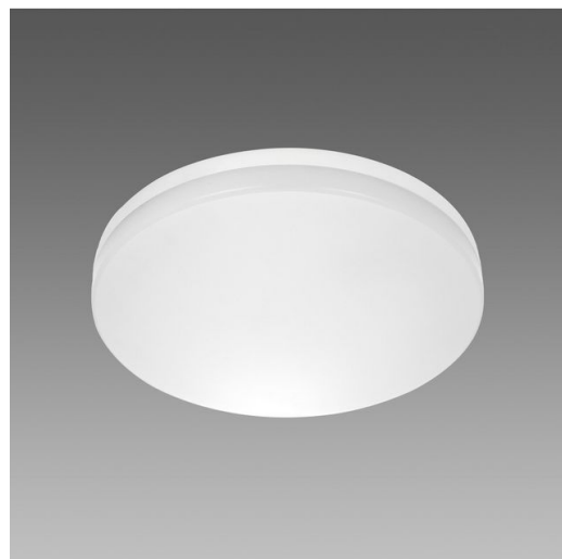
Pastilla J 2.0 - ON OFF