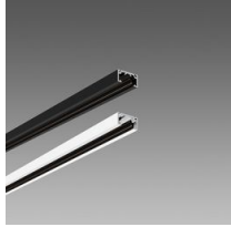
Binario 48V DC MICRO P: parete plafone