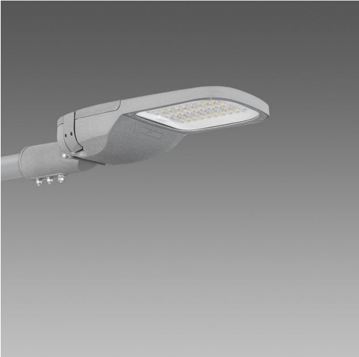
3460 Denia ES 1