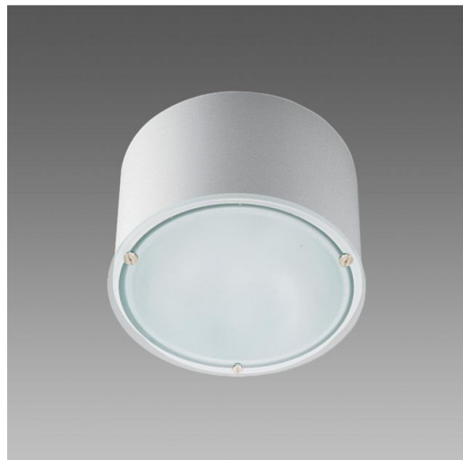
781 Compact - con SENSOR