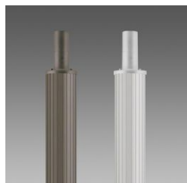
1408 Columna rayada \varnothing 100 con base