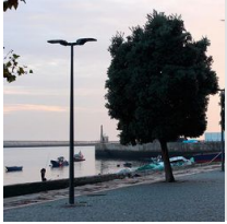
1481 columna cónica de acero para enterrar