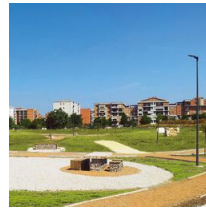
1493 Columna con base