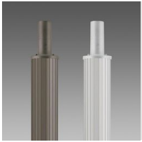
1508 Columna rayada \varnothing 120 con base