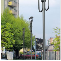
1491 Columna para enterrar