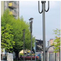
1491 Columna para enterrar