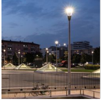
1477 Columna urbano - con base