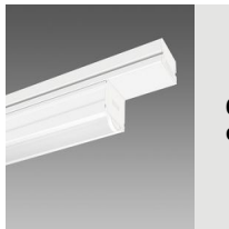
6616 Techno System HE - difusor semiesférico extensivo - CRI 80