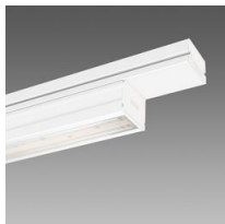
6602 Techno System - bi-asimétrico 25° - CRI 90