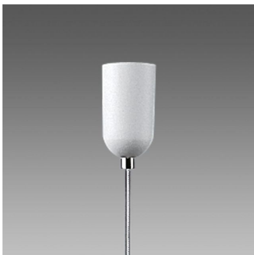
6510 Sospensione semplice